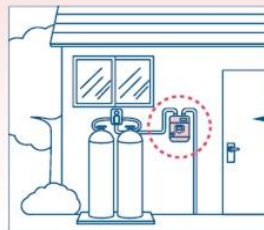
【例】一戸建ての場合